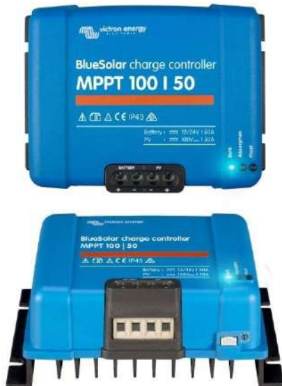
Controlador de carga solar MPPT 100/50